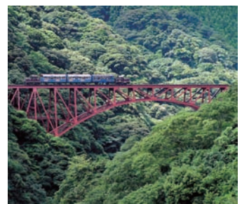
南阿蘇鉄道 第一白川橋梁