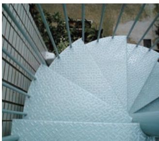
マンション縞鋼板外部階段