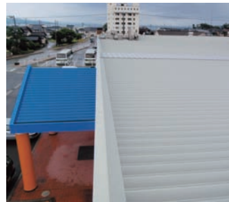
新潟県佐渡 折板屋根塗替え塗装工事