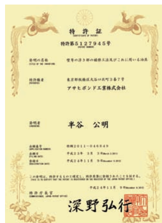
● プレスダウングラウト工法特許証