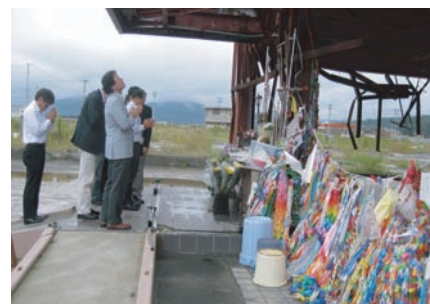
● 東日本大震災被災地視察