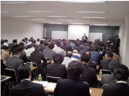
● UF 施工管理士養成講習会